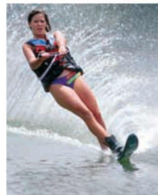
el esquí acuático