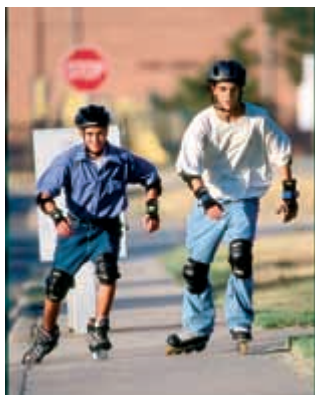
el patinaje en línea