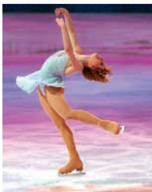
el patinaje sobre hielo